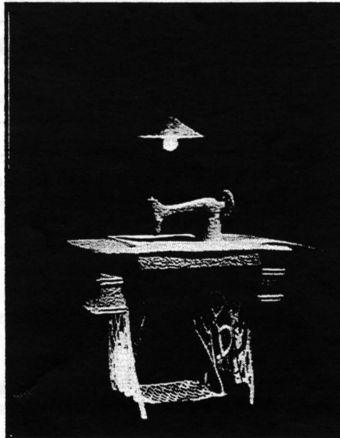
Homage to my Grandmother, sculpture by Badanna Zack.

We could always use volunteers. And above all, if you haven't yet signed up and sent in your membership fees, please turn to page 3 immediately and send in the affiliation form. Thanks!